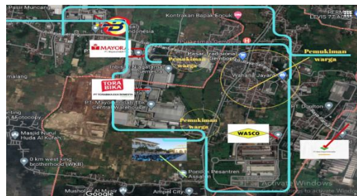
Sumber (Peneliti, 2022).